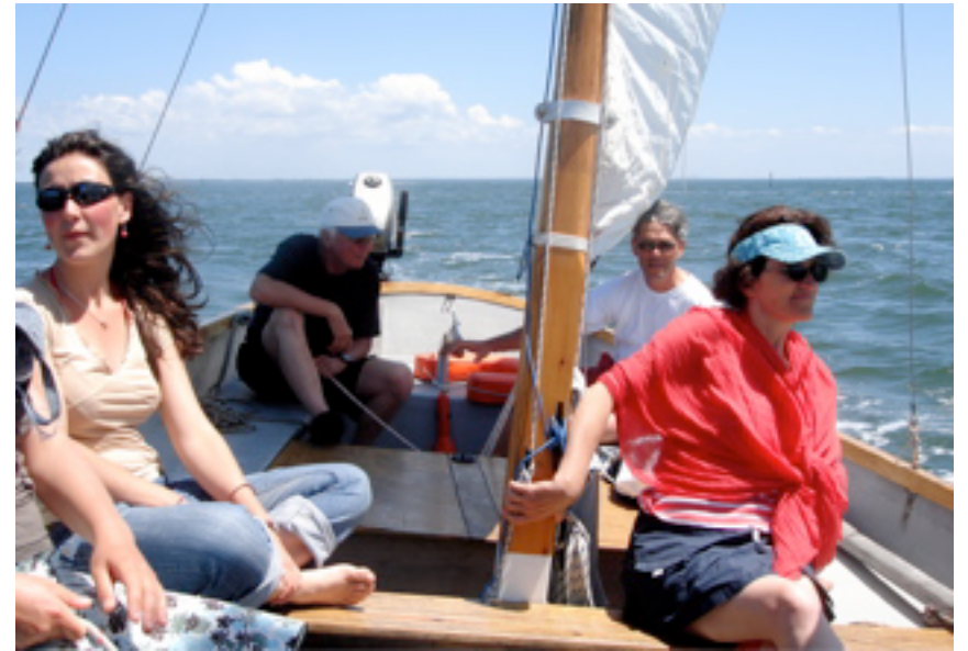
nous par là, (Andernos)